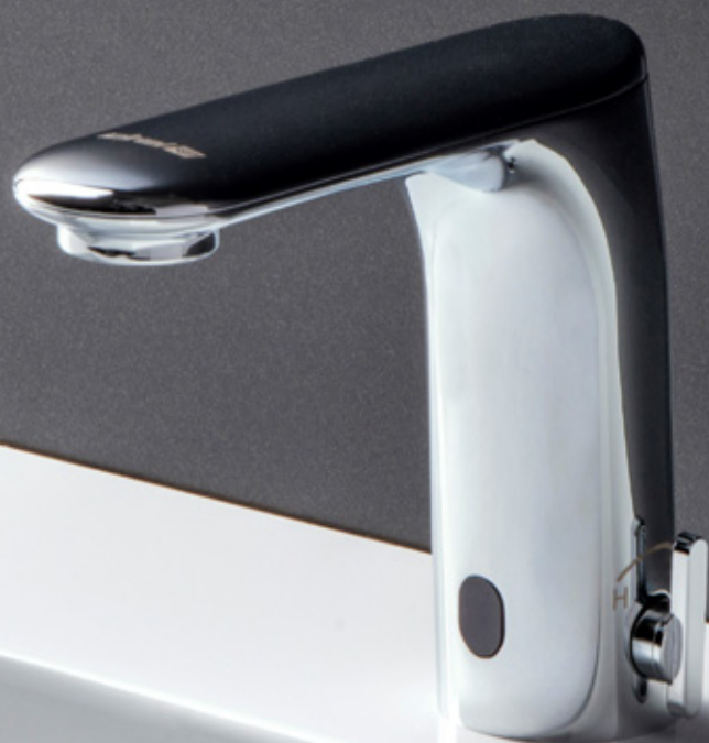
“Otto” by Luca Papini